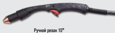
Ручной резак 15°