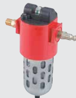
Комплект для фильтрации воздуха