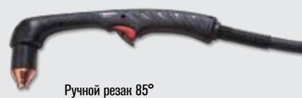
Ручной резак 85°

Стандартные типы резаков Duramax (дополнительные варианты резаков см. на веб-сайте www.hypertherm.com )