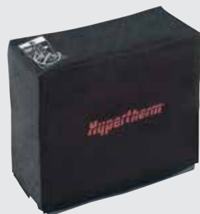
Чехол для защиты системы от пыли