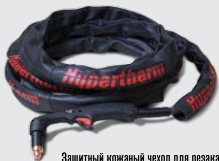
Защитный кожаный чехол для резака