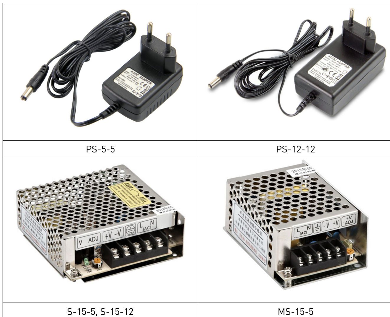
Рис. 1. Внешний вид источников питания