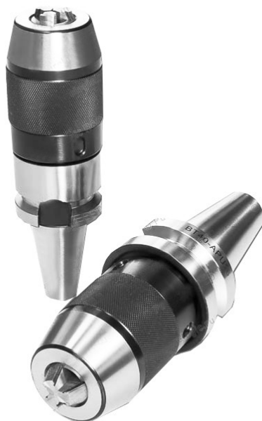
Рис. 1. Внешний вид сверлильного патрона с хвостовиком ВТ