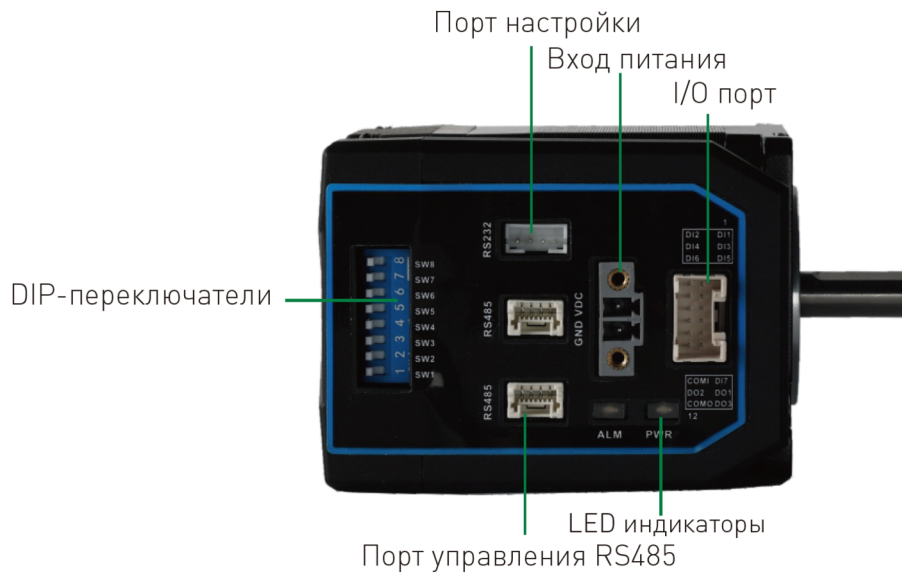
Рисунок 2 – расположение портов, индикаторов, DIP-переключателей.